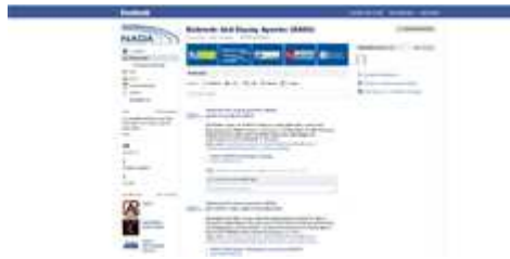
Die NADA-Seite auf Facebook