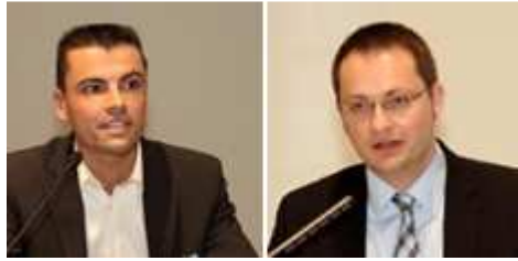
"Saubere Leistung? - Doping in Sport und Gesellschaft"