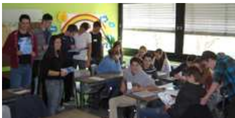
Schulveranstaltung in Dormagen