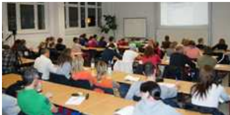
ADAMS-Schulung in Leipzig