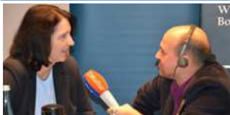
Journalisten-Workshop am 25. Oktober 2012