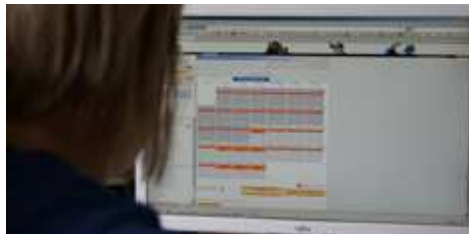
Kontaktdetails bei ADAMS für RTP- und NTP-Athleten