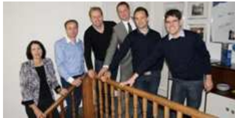
Antidoping Norge zu Gast in der Heussallee