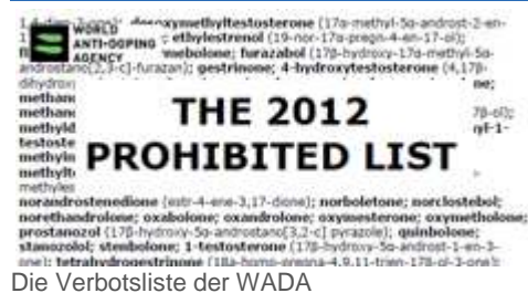
Die Verbotliste der WADA