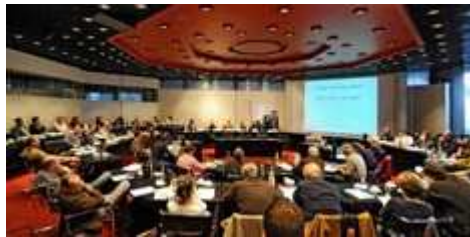
Journalisten-Workshop der NADA