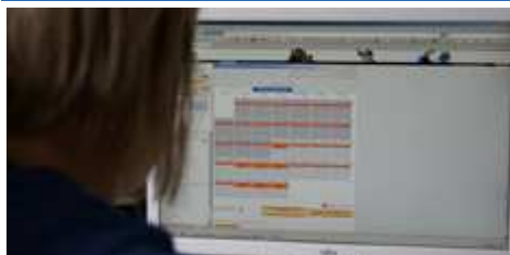
Eingabe der Whereabouts in ADAMS