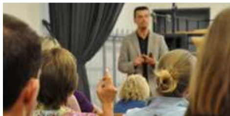
Elternveranstaltung in Frankfurt am Main