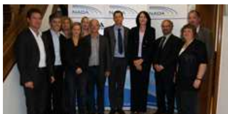
Gemeinsames Treffen zwischen WADA, den Laboren aus Köln und Kreischa und der NADA