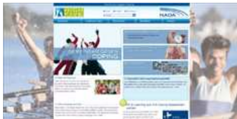
Die Website High Five für junge Sportler unter www.highfive.de