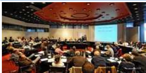
Der Journalisten-Workshop der NADA in Bonn