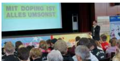
Sponsorenvereinigung S20 bei der NADA-Präventionstour