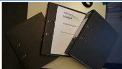
Zwei weitere olympische Sport-Fachverbände beauftragen NADA mit Ergebnismanagement