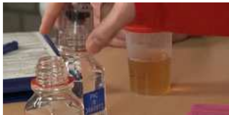
Szene aus dem Dopingkontrollfilm der NADA